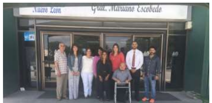
Visita Comité Técnico Evaluador de la STPS Nuevo León